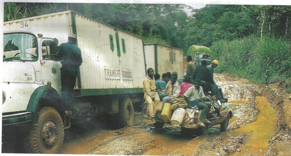
23. Le mauvais état des routes, transformées en bourbiers pendant la saison des pluies, rend les communications difficiles.

Les rails n'ont pas partout le même écartement et les interconnexions sont exceptionnelles : c'est la conséquence du découpage colonial qui a morcelé l'espace. Seule l'Afrique du Sud dispose d'un réseau ferroviaire.